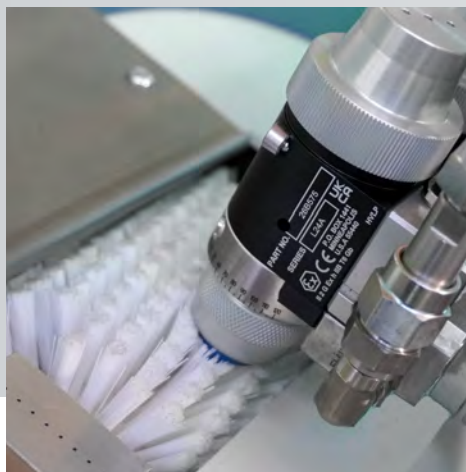
Sistema automatico per la pulizia degli ugelli Automatic Nozzle Cleaning System