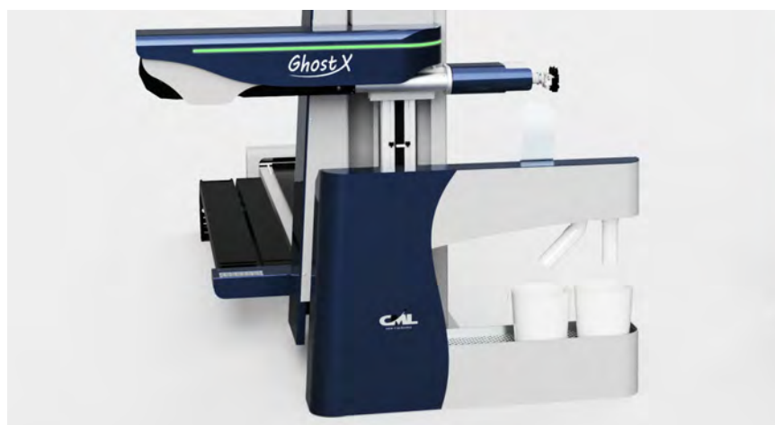
Braccio robot retro illuminato Back-lighted robot arm