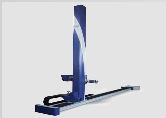
Robot di verniciatura a 6 assi mod. Ghost-X 6-axis coating robot model Ghost-X