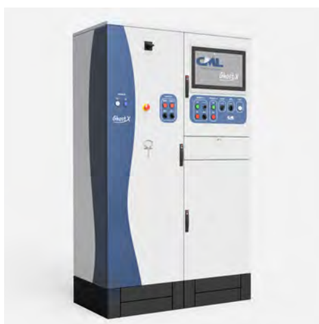
Armadio elettrico con tastiera integrata Electric cabinet with integrated keyboard