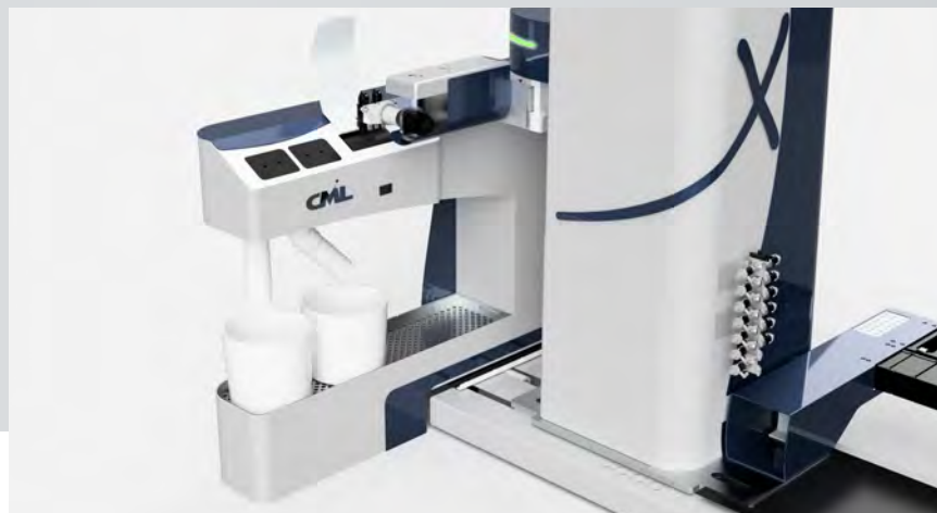
"Smart Box" per pulizia automatica della testa di spruzzatura e valvole di cambio colore "Smart Box" for automatic cleaning of spray head and color change valves