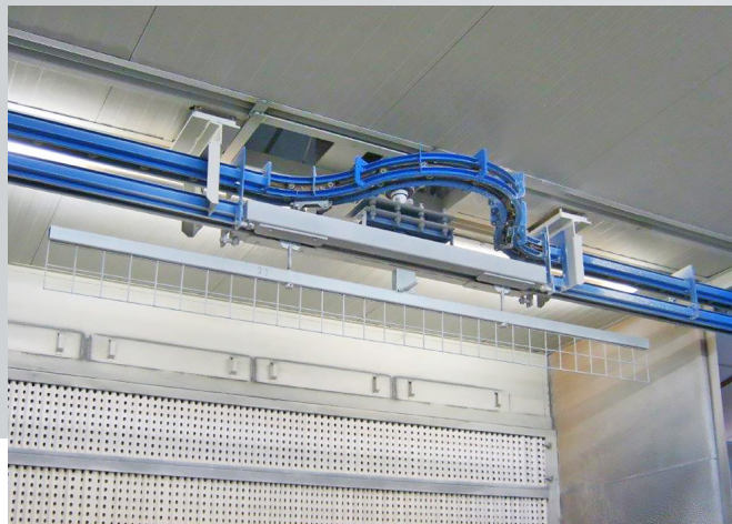
Sistemi di rotazione dei pezzi Workpiece rotation systems