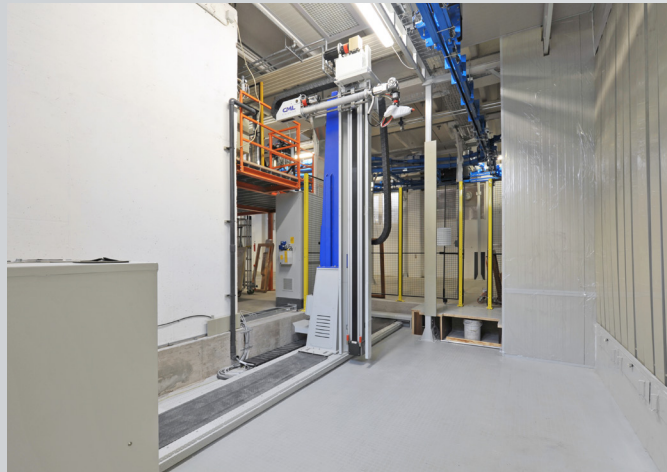
Sistemi di trasporto aereo per robot di verniciatura Overhead conveying systems for painting robots