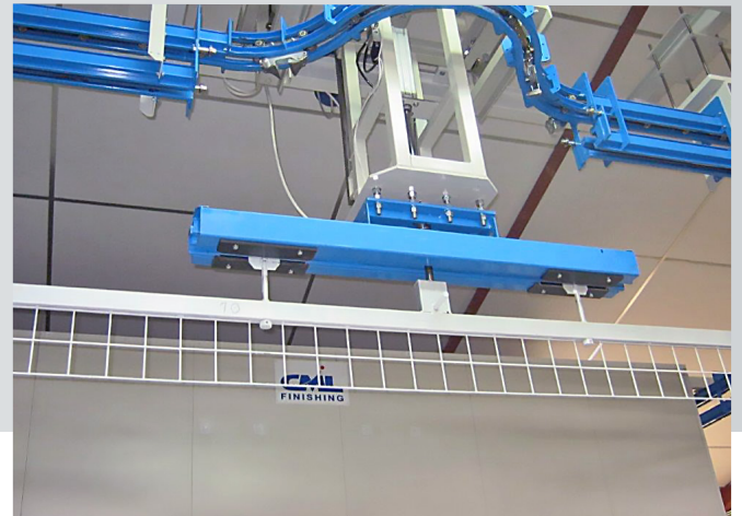
Sistemi di sollevamento e abbassamento per bilancelle porta pezzi Lifting and lowering systems for workpiece racks