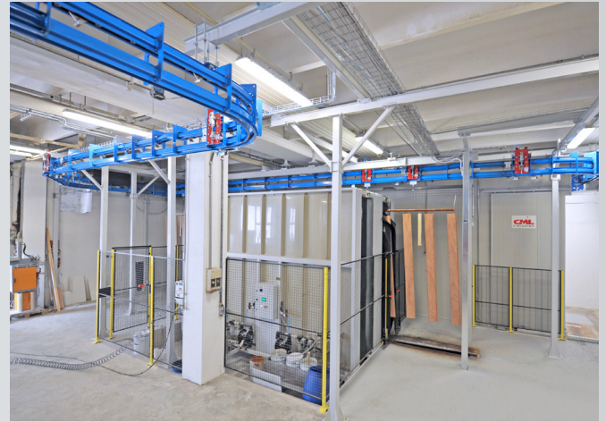
Sistemi di trasporto aereo per macchine di rivestimento a flusso (flow-coating) Overhead conveying systems for flow-coating machines